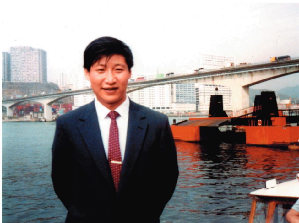
Ova fotografija je snimljena za vreme posete inostranstvu dok je bio zamenik gradonačelnika Sjamena u pokrajini Fudian.