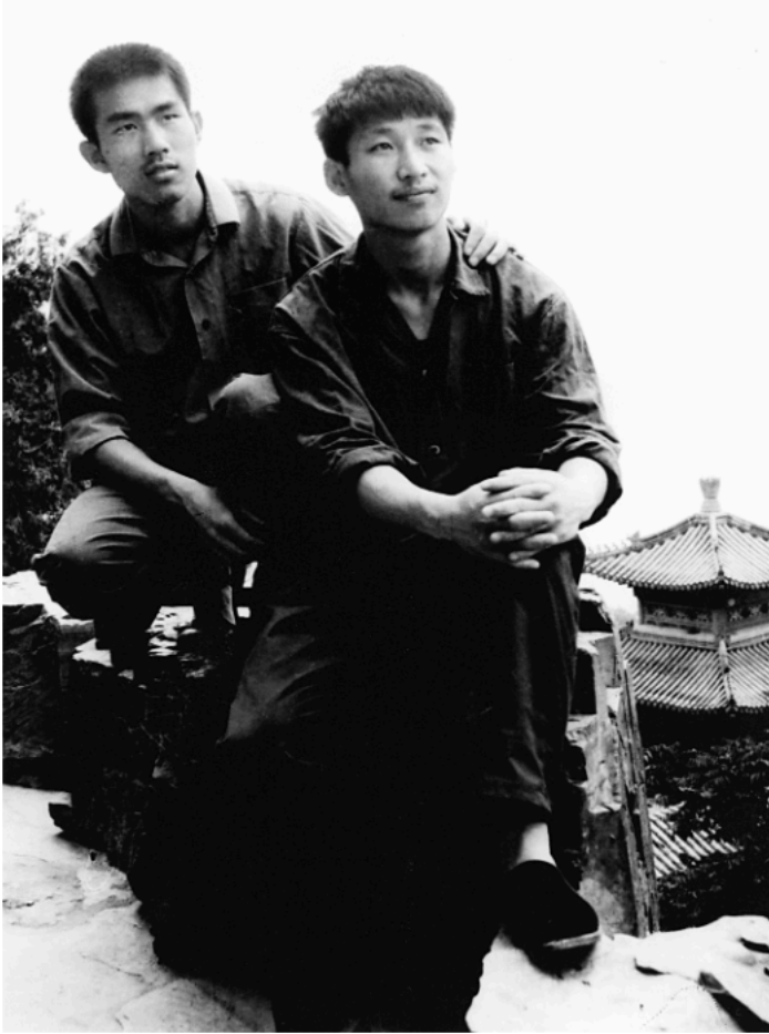
Ova fotografija je snimljena 1977, kad je bio student na univerzitetu Cinghua (desno).