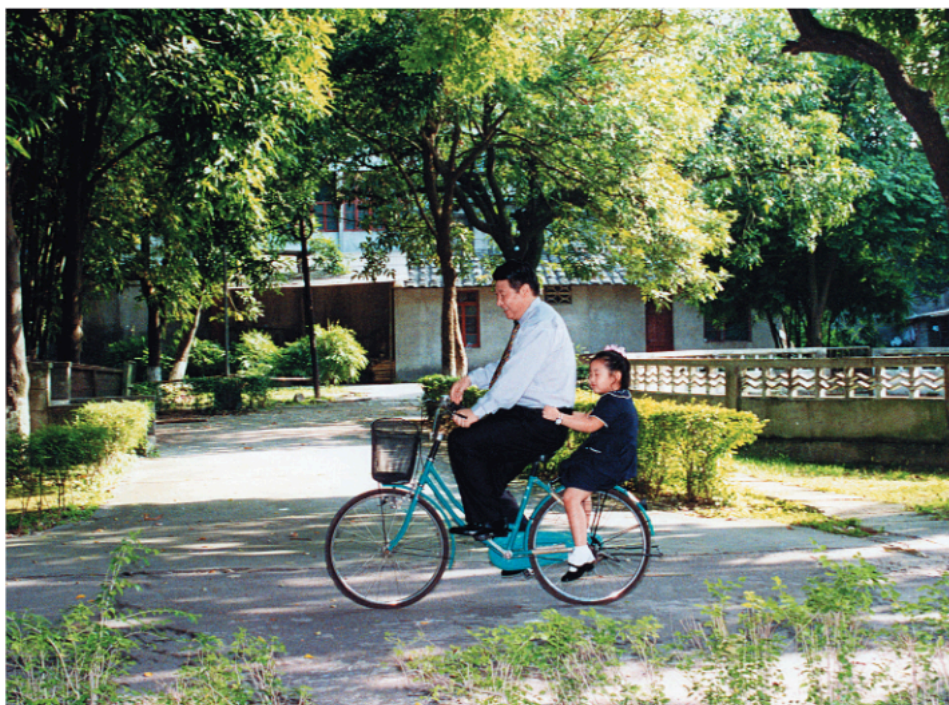
Sa ćerkom Mingce na biciklu u Fudžouu u pokrajini Fuđian.