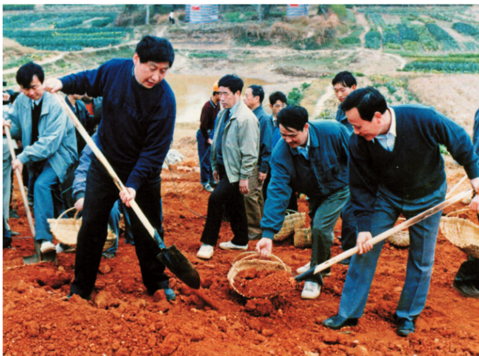
Pri pomaganju timu da se ojača nasip i spreči izlivanje donjeg toka reke Minđang u srezu Minhou, u decembru 1995. U to vreme bio je sekretar Gradskog komiteta KPK u Fudžouu u pokrajini Fuđian, i zamenik sekretara Pokrajinskog komiteta KPK u Fuđianu.