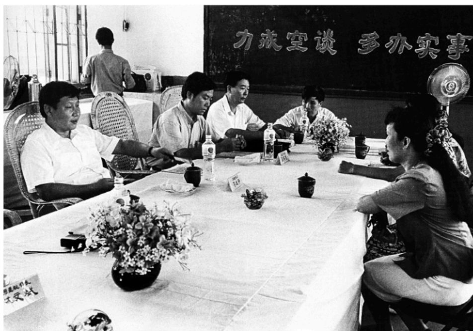
Avgusta 1993 , Si Đinping, sekretar Gradskog komiteta KPK u Fudžouu u pokrajini Fudian primio je građane zajedno sa funkcionerima grada Fudžoua i opštine Taijianga na dan zakazan u tu svrhu.