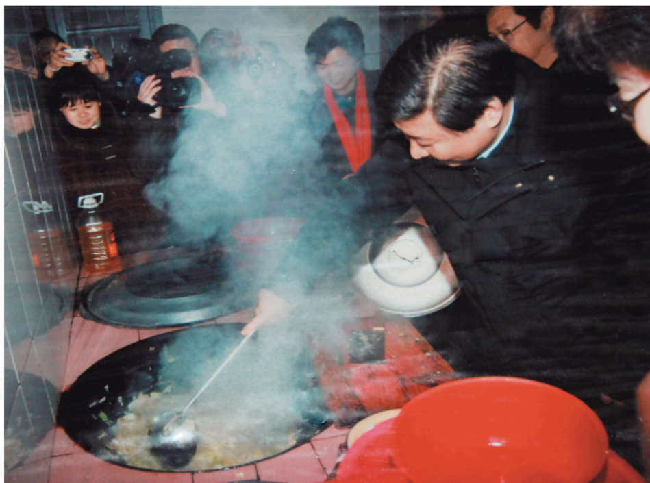
Tokom posete staračkom domu u Pingduu, u srezu Čingjuen u pokrajini Džeđiang, u januaru 2007, kuvao je za stare. U to vreme bio je sekretar Pokrajinskog komiteta KPK u Džeđiang.