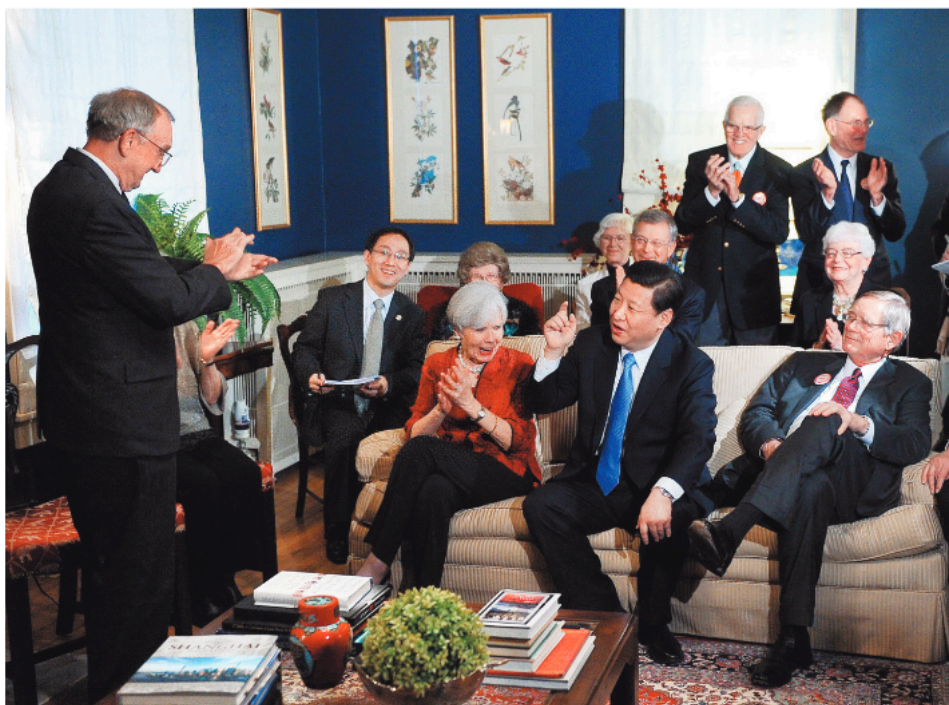
Sa američkim prijateljima s kojima se upoznao dvadeset sedam godina ranije, u ponovnoj poseti Ajovi, u februaru 2012.