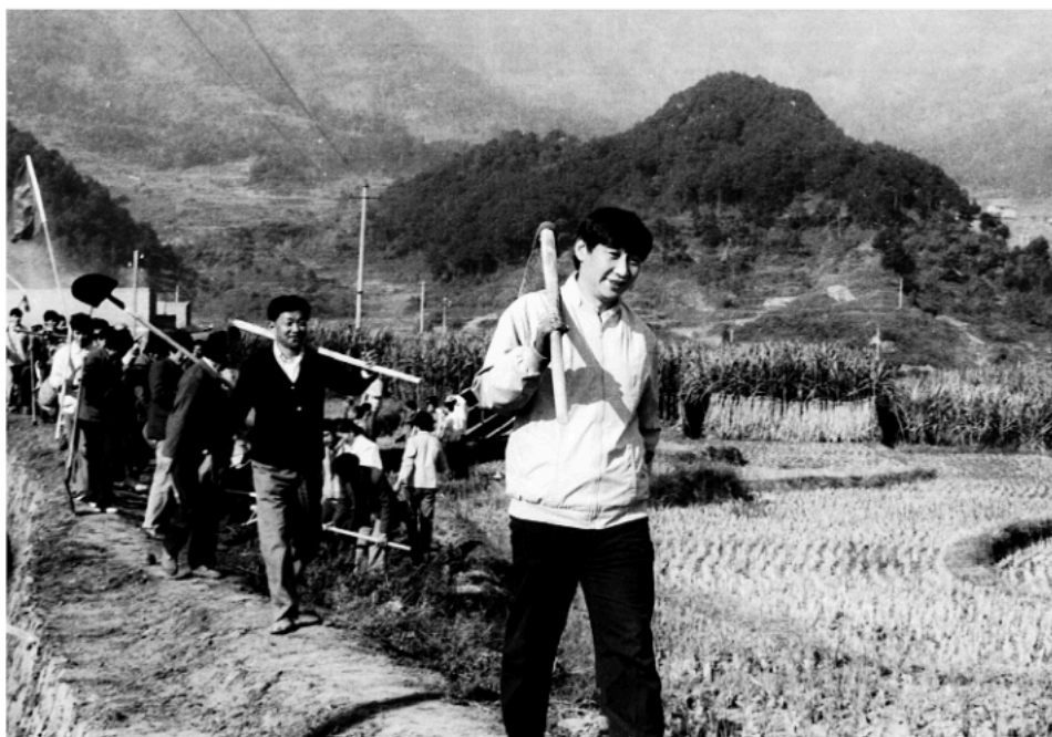
Zajednički rad sa meštanima tokom inspeksijskog obilaska iz 1989, kad je bio sekretar Okružnog komiteta KPK u Ningdeu u pokrajini Fudian.