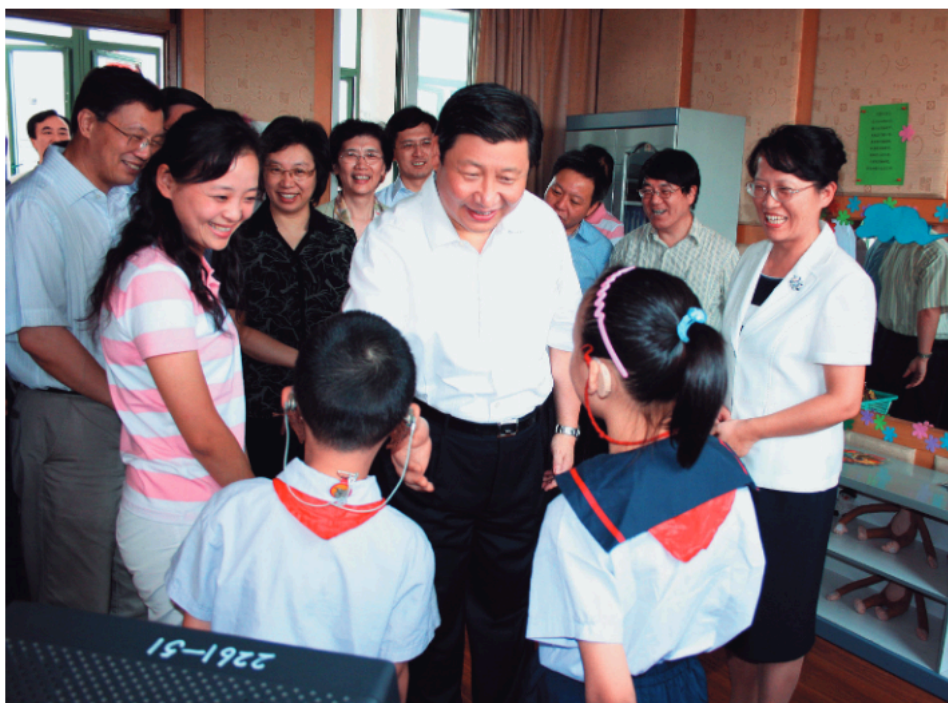
U razgovoru sa decom oštećenog sluha u školi Čijin u opštini Minhang u Šangaju, u septembru 2007. U to vreme bio je sekretar Gradskog komiteta KPK u Šangaju.