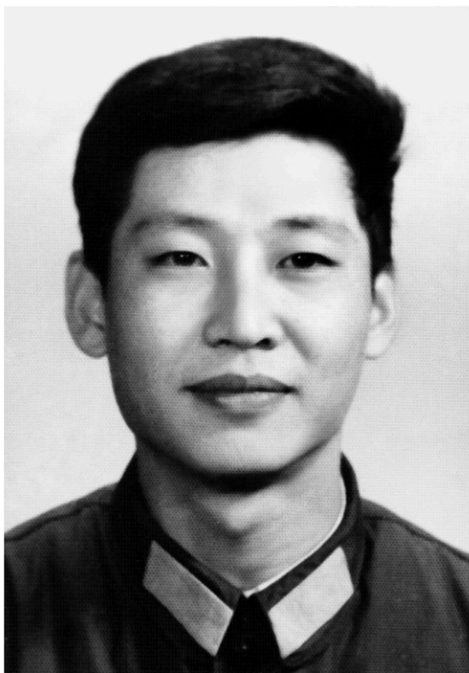
Ova fotografija je snimljena 1979, kad je radio u Glavnoj kancelariji Centralne vojne komisije.