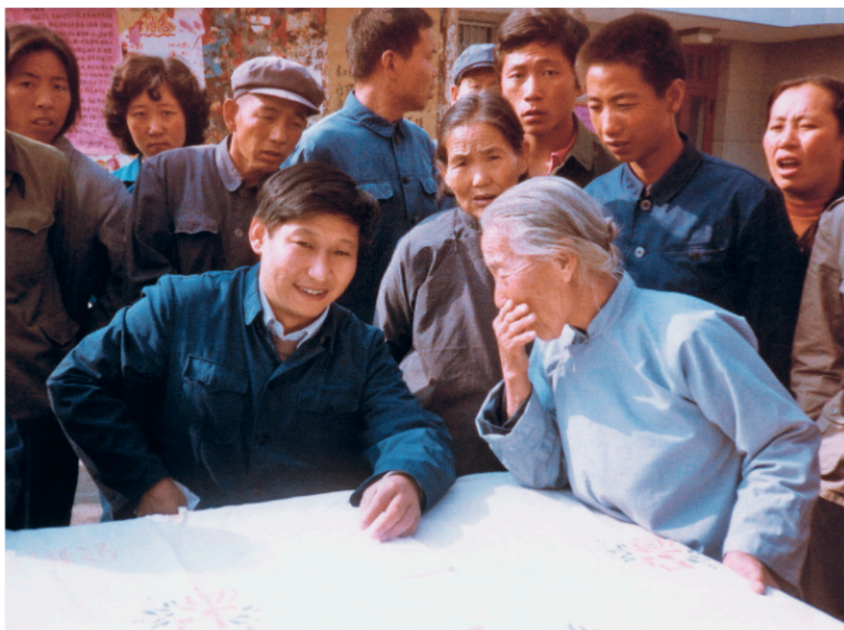
Godine 1983, Si Đinping, sekretar Okružnog komiteta KPK u Džengdingu u pokrajini Hebej, postavio je sto na ulici da čuje mišljenje građana.