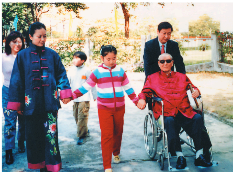
Sa suprugom, ćerkom i ocem Si Džongsjunom.